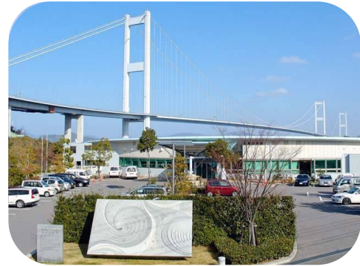
サンライズ糸山全景