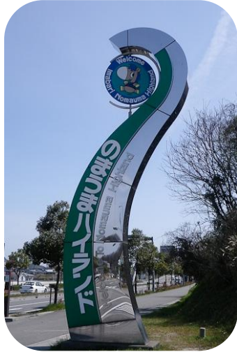
入口モニュメント

野間馬（のまうま）とは野間（愛媛県今治市）で飼育されている日本在来種の馬です。体高はおよそ110-120cmと小型で、ポニーに分類されます。毛色は栗毛、鹿毛が中心です。