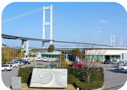
サンライズ糸山全景